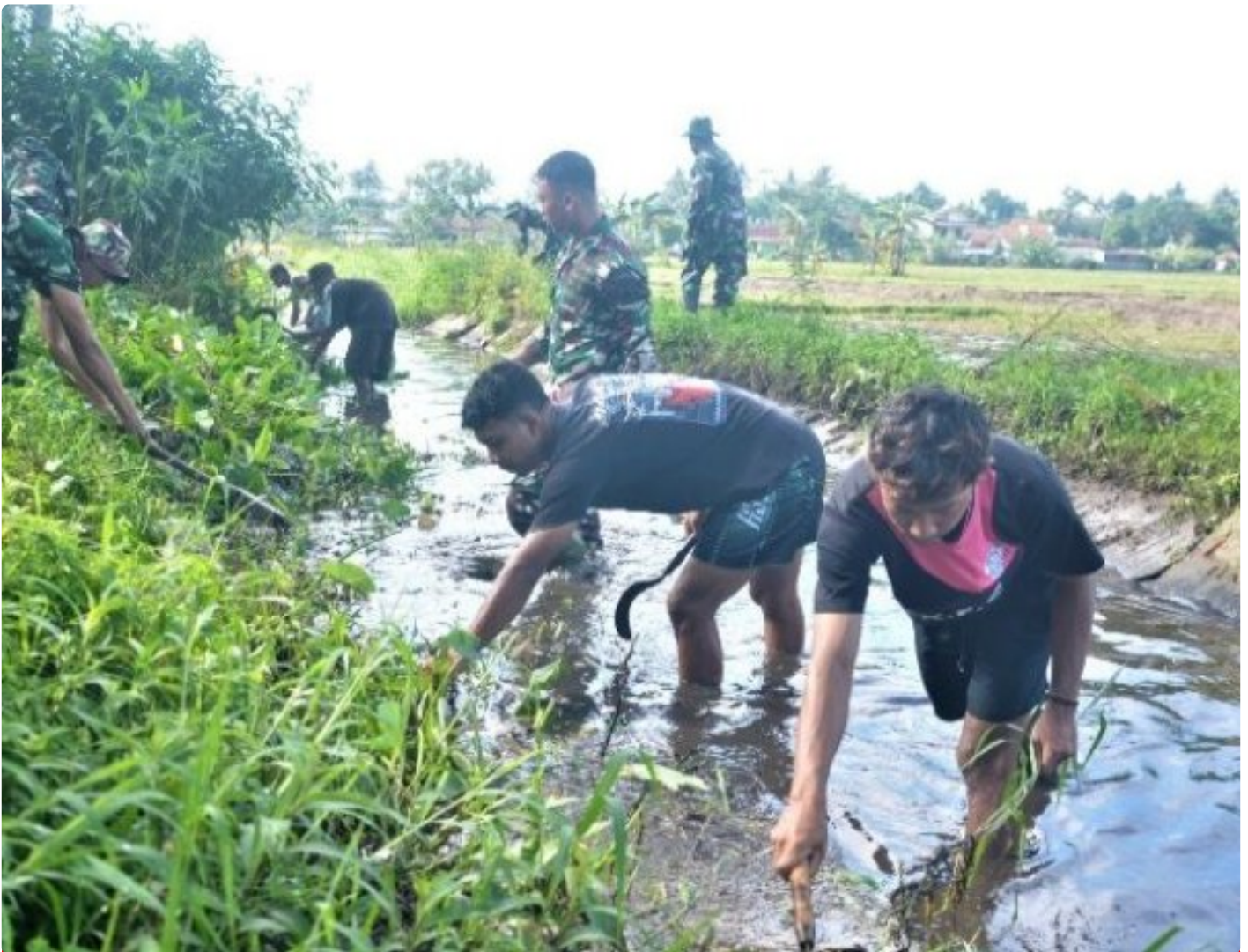
Sungai Si Rompang dibersihkan TNI Korem 071 Wijaya Kusuma

BANYUMAS - Sungai Si Rompang atau kali dalam sebutan masyarakat Banyumas, yang melintas tepat di belakang lingkungan Makorem 071/Wijayakusuma, sebagai aliran sungai yang banyak digunakan untuk kehidupan masyarakat sekitarnya seperti untuk pengairan pertanian, peternakan maupun perkebunan.